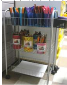
Petit chariot mobile (EM Zillisheim)