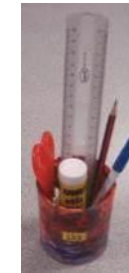
Pot individuel : étape transitoire vers l'usage de la trousse en cours de GS (EM Zillisheim)